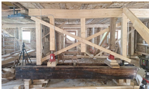
Abstützung, Versteifung innen und außen zur einseitigen Anhebung des alten Gebäudes um 36,6 cm

auf der Baustelle beteiligt. Neue Zahlen und Daten werde ich erst am Ende der Maßnahme in Abstimmung mit unseren Architekten zusammenführen. Natürlich hatten wir einen komplett durchgehenden Einsatz unserer Hausmeistereimitarbeiter/-innen, je nach Zeit und Einsatzmöglichkeit in Abstimmung mit unserem Architekturbüro Peter Schaller und den Handwerkern vor Ort. Es ist ein wunderbares erfreuliches Zusammenarbeiten untereinander. Für mich war deutlich erkennbar, dass auf der Arbeit für unseren Sperlingshof der Segen unseres Heilandes ruht, uns begleitet und beschützt. Wieviel gute Worte konnte ich bei meinen wöchentlichen Terminen auf der Baustelle oder bei den Bauterminen und Kostenbesprechungen und Nachverhandlungen der Angebote und Freigaben hören. Immer wieder konnte man den roten Faden des Gottvertrauens der christlichen Nächstenliebe aus den Worten und Gesten der Handwerker und Architekten in der Zusammenarbeit erkennen.