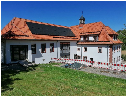
Bauzustand Mai 2026, die Außenanlage kommt jetzt

Nun möchte ich über die anstehenden Termine für die Einweihung des sanierten Sperlingshofes und den Um- und Anbau informieren: