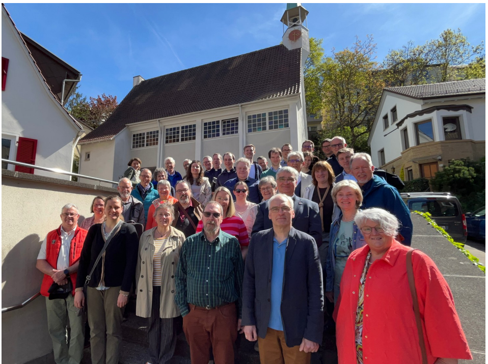
Die Mitglieder der Bezirkssynode